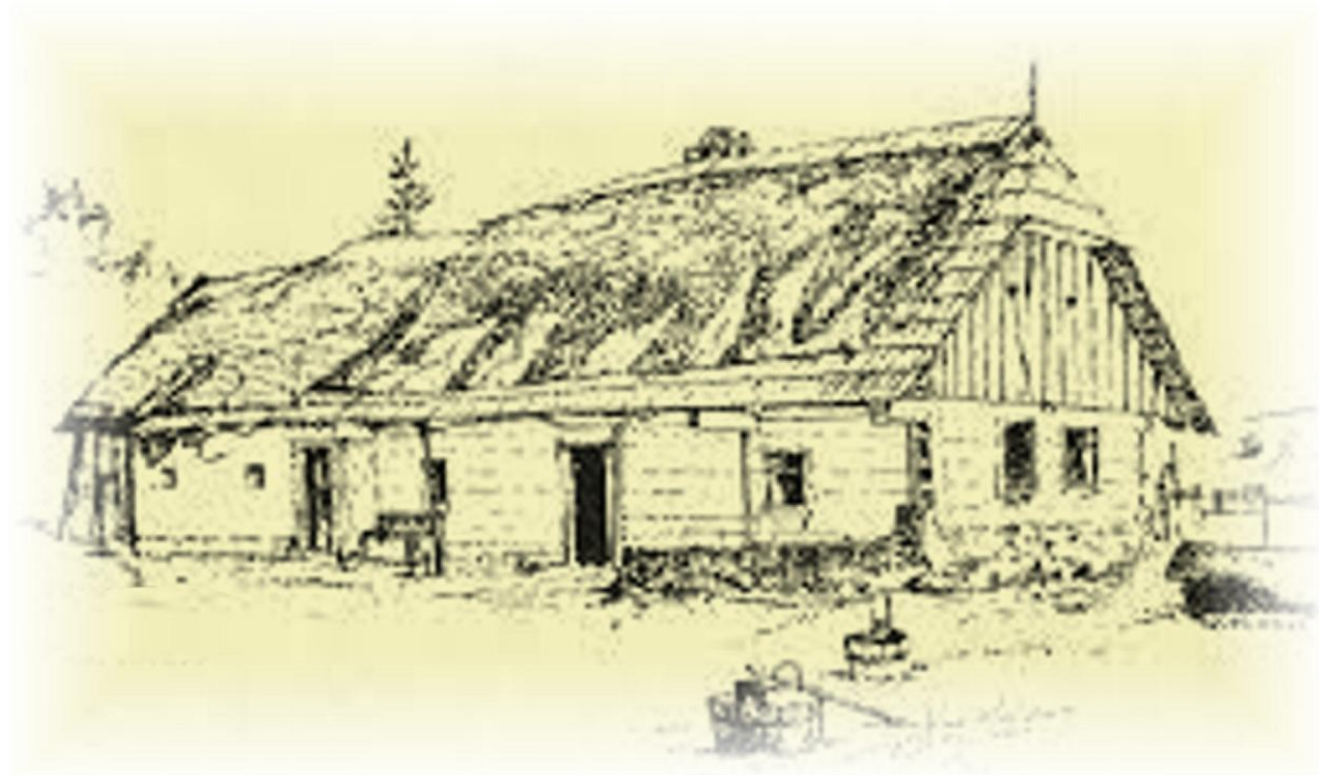
ilustrační obrázek fary

Fara bylo obydlí a zároveň úřadovna faráře, úřední sídlo farnosti a případně i místo jejich dalších, zejména neliturgických aktivit. Jednalo se mnohdy o nejdůležitější budovy v obci po kostele a rychtě. Na faře se zpravidla odehrávaly osudové okamžiky lidských osudů: domlouvaly se zde křtiny, ohlášky i pohřby. Fara stála většinou poblíže kostela, k faře patřilo také malé hospodářství k obživě a faráře, ves také mívala k faře naturální povinnost.