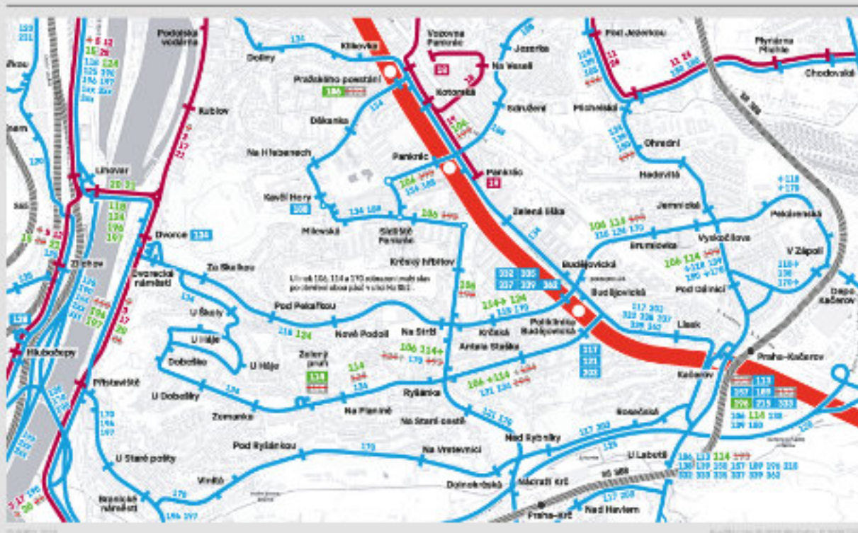
TT Dvorecký most – změny linkového vedení autobusů v oblasti Prahy 4 mapa dotčené oblasti – cílový stav po zprovoznění obou pásů ulice Na Strži

Podrobnější informace, nejen o provozu na Dvoreckém mostě, najdete zde: https://pid.cz/projekty-a-dokumenty/nove-tramvajove-trate-pro-150-000-cestujicich-kazdy-den/ a podrobnější vysvětlení k připravovaným změnám v provozu linek PID pak zde: https://pid.cz/nove-tramvajove-trate-pro-150-000-cestujicich-kazdy-den-vysvetleni-zmen-v-kontextu-dokumentu-rozvoj-linek-pid-v-praze-2022-2032/ .